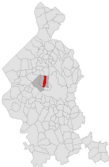
I comuni appartenenti all'Ambito nord del Lago di Varese