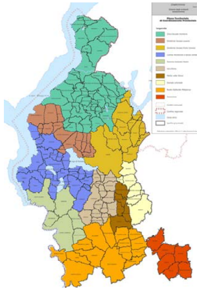
Gli Ambienti economici-produttivi del PTC della Provincia di Varese

Barasso fa parte di un sistema lineare continuo, a carattere prevalentemente residenziale, che si attesta sulla strada statale 394 ed è attraversato dalla linea ferroviaria Milano-Saronno-Varese-Laveno Mombello. L'ambito, definito come "Ambito nord del lago di Varese", comprende anche i comuni di Luviniate, Comerio, Gavirate.